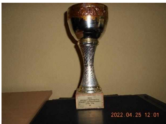
XXXV. Országos Elsősztályú Horgász Csapatbajnokság Győr 1998. III.