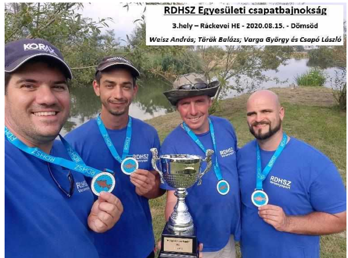
R.D.H.SZ. Egyesületi csapatbajnokság 3.-hely Ráckevei HE. 2020.08.15.