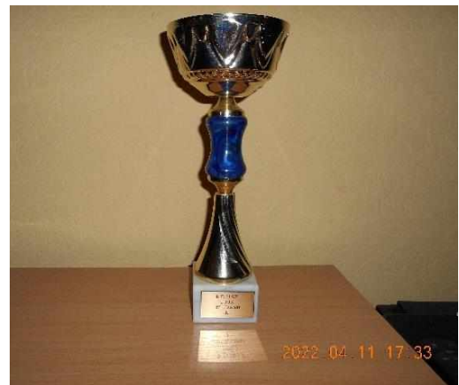
R.D.H.SZ. "B" Csapat 2003 I.