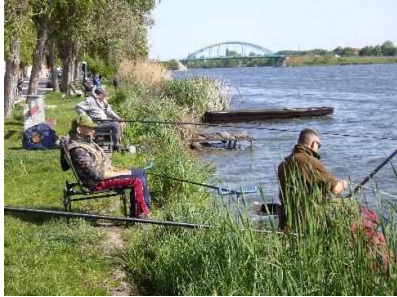
Házi felnőtt halfogó verseny 2014