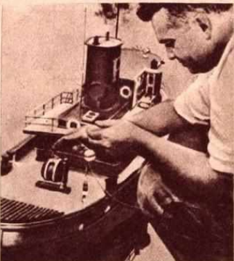
Íme a kis hajó közelről, hátsó fedélzetén „legfontosabb” alkatrészével, az orsóval