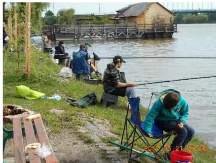
Gyermek és Ifjúsági horgászverseny 2017