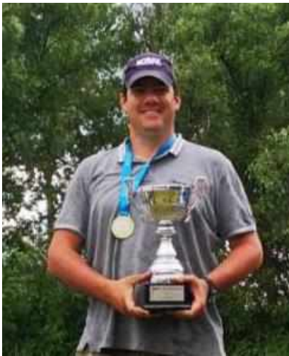
R.D.H.SZ. Úszós Felnőtt Egyéni bajnokság 2020