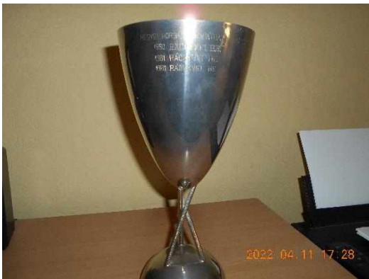
Megyei Horgász Csapatbajnokság Győztese Ráckevei HE 1980 1981 1982