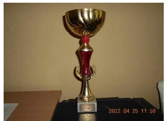
R.D.H.SZ. 2001. "B" csapat II.