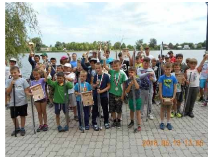
Dunaparti Általános Iskolák horgászversenye díjazottak 2018