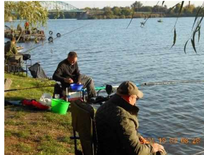
Jubileumi halfogó verseny 80 éves egyesület